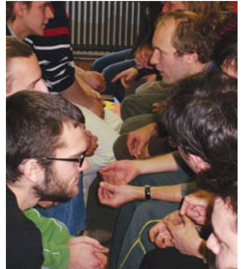
oben links | Zivildienstleistende üben, wie bei Konflikten eingegriffen werden kann.