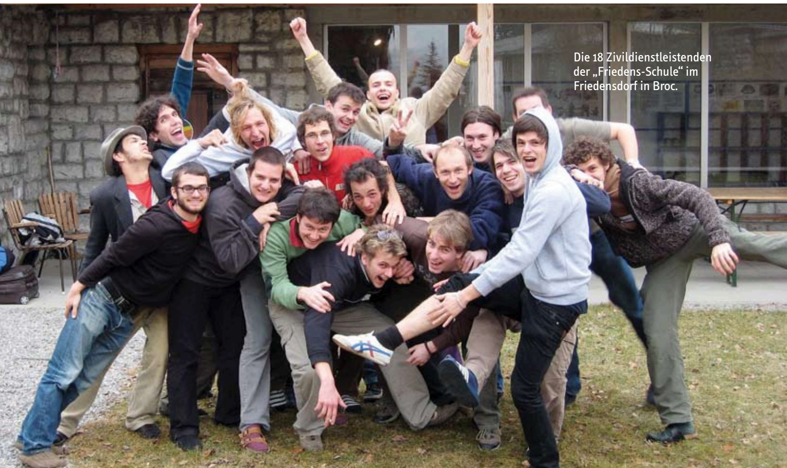
Die 18 Zivildienstleistenden der „Friedens-Schule“ im Friedensdorf in Broc.